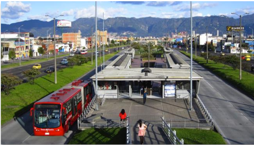
En plein cœur de Bogotá, les bus TransMilenio disposent de 144 kilomètres de voies réservées, avec des arrêts conçus comme des stations de métro.