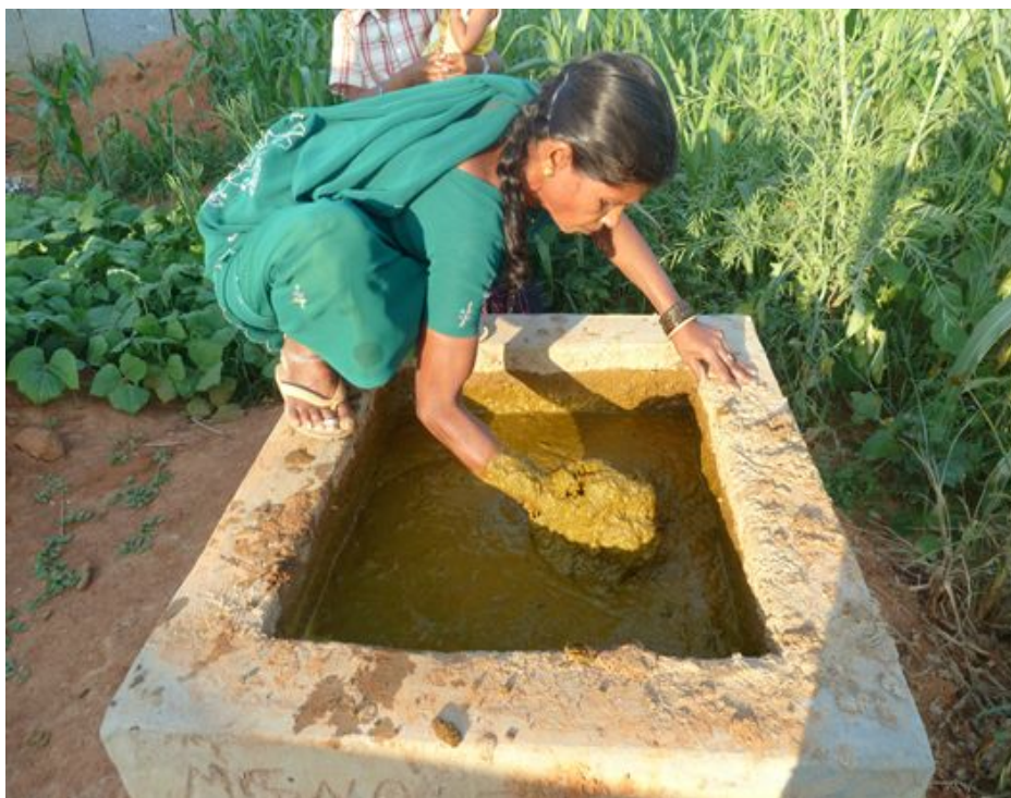
En Inde, une femme alimente un digesteur avec les excréments de ses vaches pour produire du biogaz, qui lui permettra de cuire ses aliments.

En Inde par exemple , des projets sont mis en place pour aider les familles à créer leur propre digesteur. En effet, l'Inde souffre d'une grave déforestation et la cuisson au bois crée de la pollution qui rend malades les femmes qui cuisinent. Le principe est simple : les familles utilisent les excréments de leurs vaches pour produire de l'énergie. Le biogaz qui ressort du digesteur alimente un réchaud qui leur permet de cuire leurs aliments. La bouse de deux vaches assure la cuisine quotidienne d'une famille de quatre personnes.