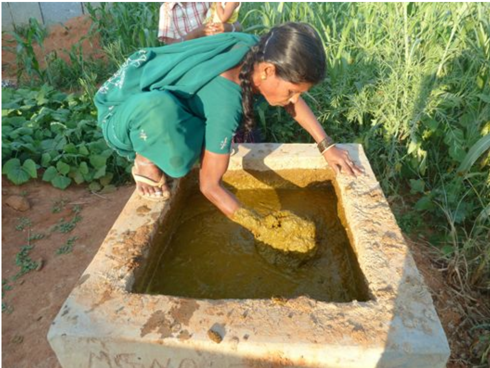
En Inde, une femme alimente un digesteur avec les excréments de ses vaches pour produire du biogaz, qui lui permettra de cuire ses aliments.

En Inde par exemple , des projets sont mis en place pour aider les familles à produire leur propre biogaz. En effet, l'Inde souffre d'une grave déforestation et la cuisson au bois pollue l'air et rend malades les femmes qui cuisinent. Le principe est simple : les familles utilisent les excréments de leurs vaches pour produire de l'énergie. Elles les font fermenter dans un réservoir, le digesteur . En ressort du biogaz qui alimente un réchaud où elles cuisent leurs aliments. La bouse de deux vaches assure la cuisine quotidienne d'une famille de quatre personnes.