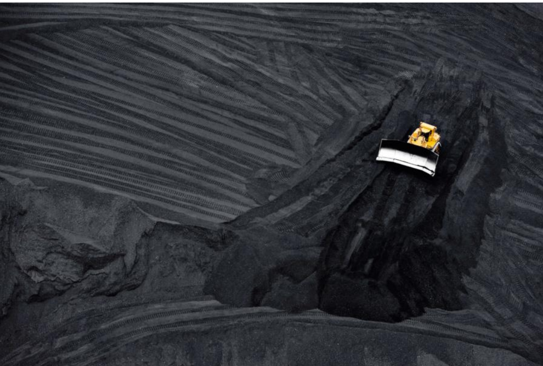
Mine de charbon à ciel ouvert en Arizona, États-Unis

En France, la dernière mine de charbon a fermé il y a 15 ans. Pourtant, le charbon est loin d'être enterré : de nombreux pays plébiscitent au contraire ce combustible pratique et bon marché. Un choix dangereux car c'est l'énergie fossile la plus polluante et la plus néfaste pour le climat.