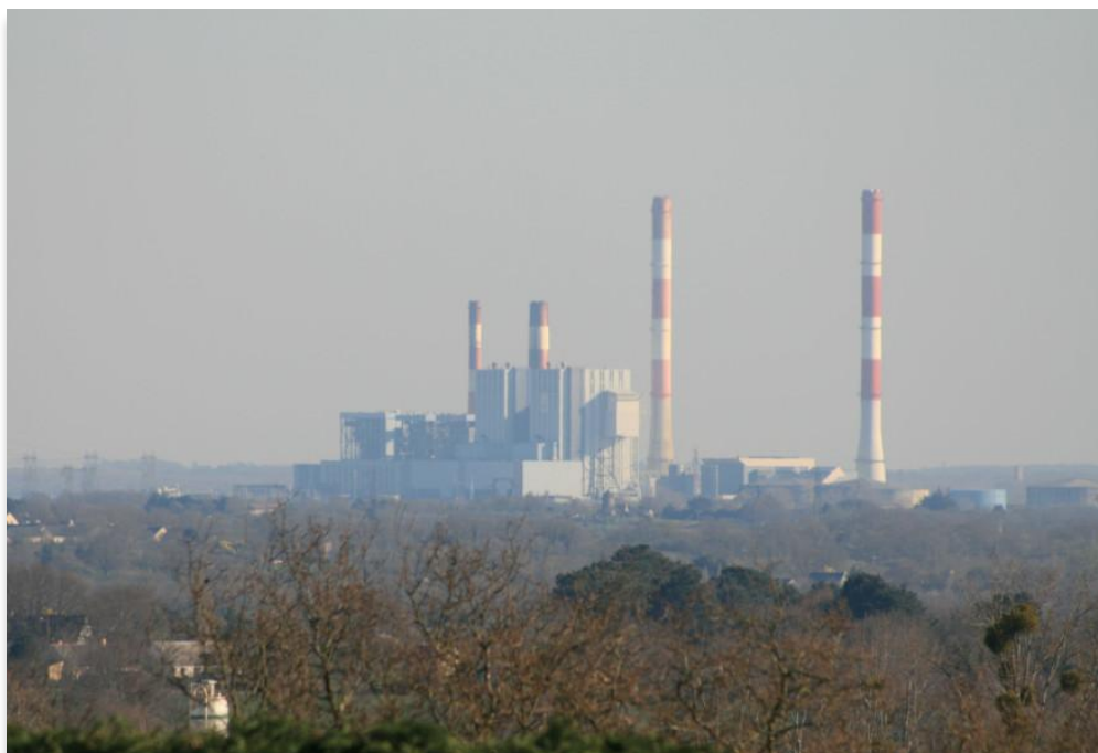
La centrale électrique de Cordemais (Loire-Atlantique) fonctionne au charbon